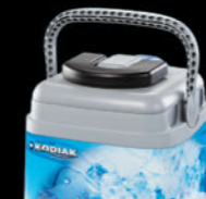
■バッテリーパック 品番：97050 (単三電池4本付属)