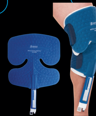
■マルチユースパッド 品番：10240