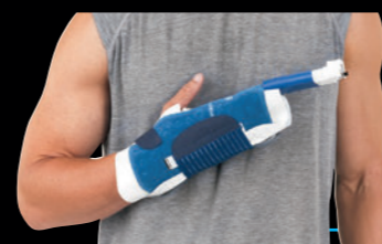
■ハンドリストパッド 品番：10260