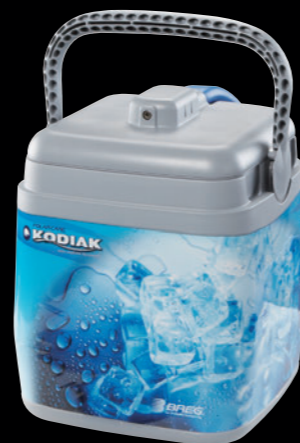
■コディアック 品番：10601 (本体・チューブ・ACアダプター)