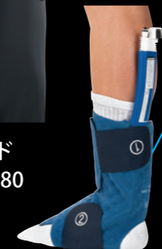
■アングルパッド 品番：10210