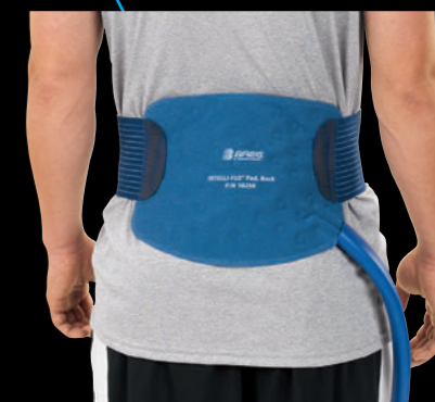
■バックパッド 品番：10250