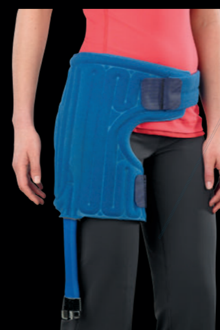
■ヒップパッド 品番：10280