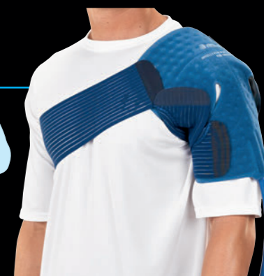
■ショルダーパッド 品番：10220